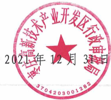
2021 年第七批告知承诺制建筑业企业资质发证名单汇总表